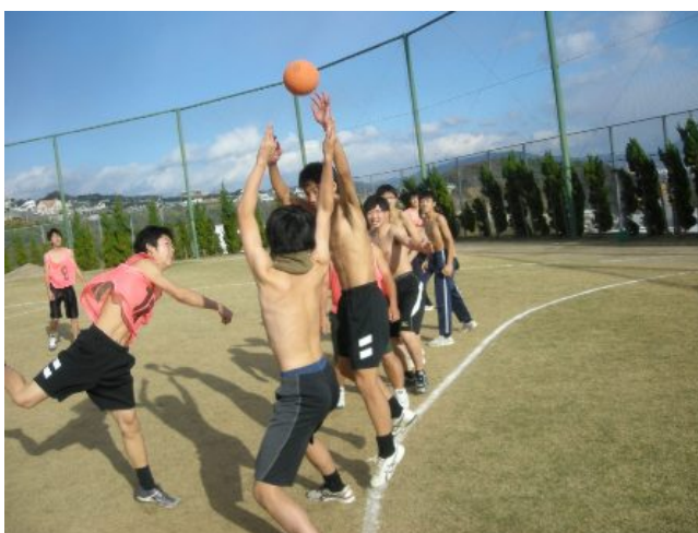
試合の方はというと、裸の男たちの祭りがごとくとても熱い戦いが繰り上げられました。前後半合わせて40分ほどのゲームでした。さて、結果はというと…