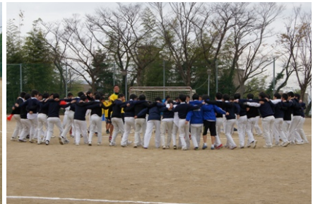
両チーム円陣を組んで気合いを入れます。高2の円陣（写真右）をよく見てみると、D組だけではなく残りの3クラスからのたくさんの応援団が円陣に入っていました。