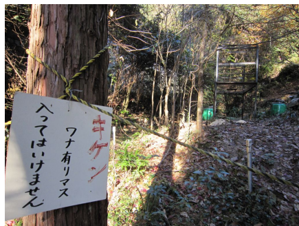
「キケン、ワナ有リマス」

試験中の生徒にも伝えたいフレーズですが…こちらはイノシシ捕獲用の罠です。警備員さんの話では、夜になるとイノシシのほかにももちろんキツネなども出るそうです。