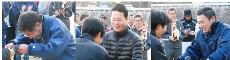
大きな怪我がなくてなによりでした…夜の部もとどおりに終了しました 次回は5月に開催予定、もちろん新入生（58K）のおやじのみなさまも大歓迎です！