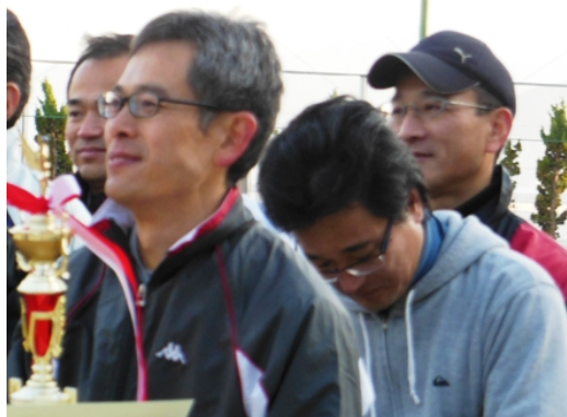
表彰されたおやじのみなさんです