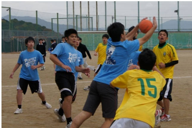
決勝ともなると両チーム目つきは真剣そのもの！男だちのプライドをかけた戦いが繰り広げられました。