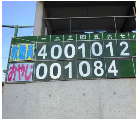
いずれも5回裏にドラマが・・・優勝は「中学・OBおやじ」チームでした