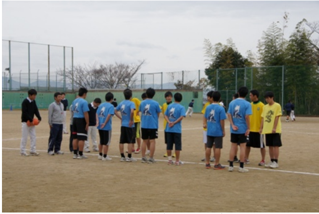
先週の金曜日のお昼休みに高校クラスマッチ（ハンドボール）決勝が行われました。 対戦カードは高3 B（青）対高2 D（黄）です。