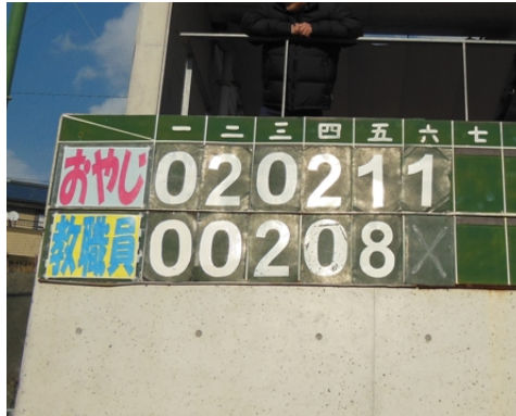
「教職員」VS「中学・OBおやじ」

昨日は小雪舞う中、予定通りソフトボール大会が行われました 「高校おやじ」VS「教職員」