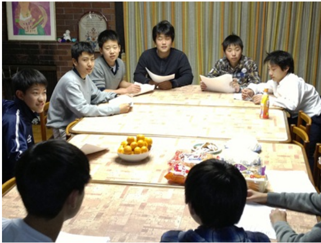
一夜漬けのパワーはここでも発揮されるのでしょうか.....