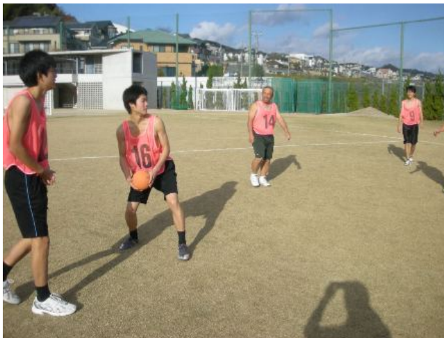
メッシュ（小さい穴）の入ったピブスでは、まったく寒さのぎになりません。それどころか、シースルーのピンクのタンクトップがどこか昭和のアイドルに見えてこ小っ恥ずかしい格好になりました。