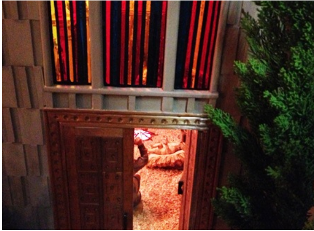
今晚は中2がお泊りで、あす上演する劇の練習に励みます