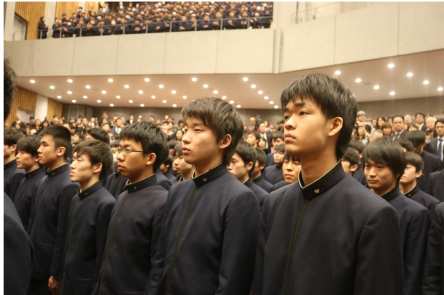
緊張の中、凛々しい表情の高3（57期生）が入場します。