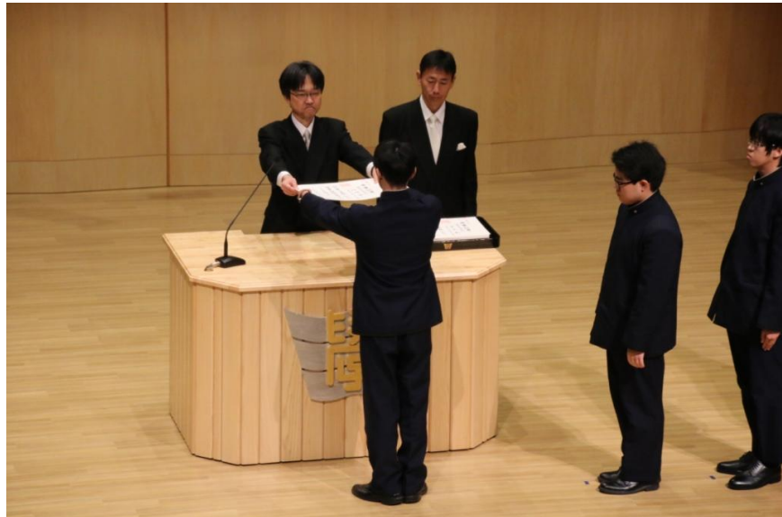
校長より卒業証書を受け取ります。