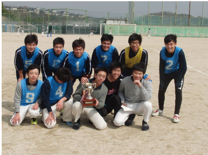
On a blustery spring day, the Final of the Gakuin Cup was held. Two 高2 teams vied for the trophy. With strong wind and indefatigable spirits the two teams battled. In the end, 高2A was the tougher of the two and triumphed.