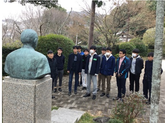
アルベ神父様は、ここ長束を拠点に被爆者を救護し、全世界に広島を訴え続けました。