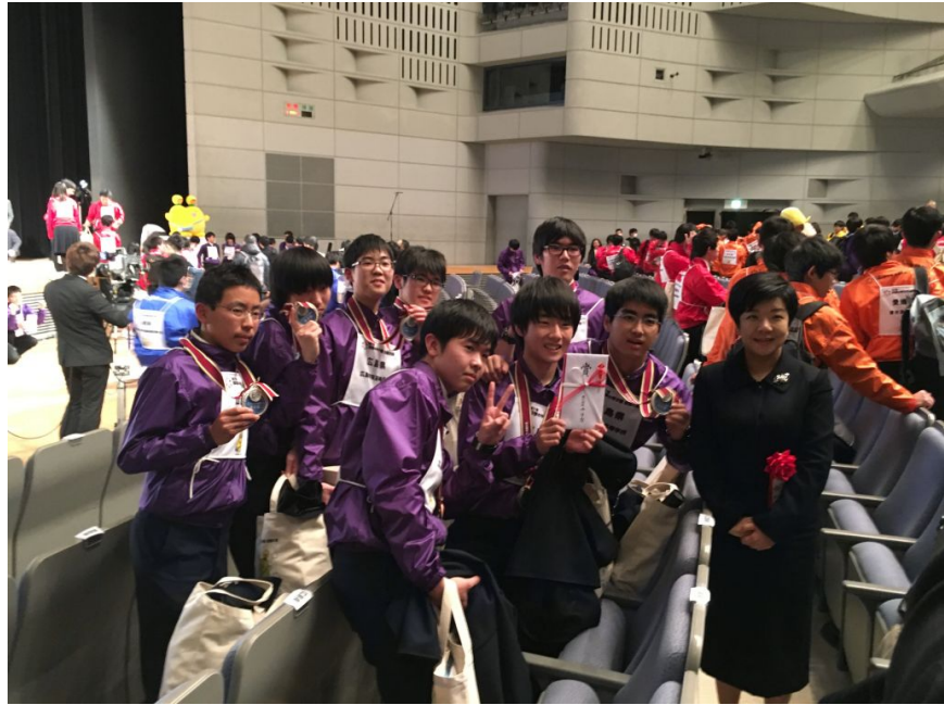
コバトン(実物)も来てくれました。