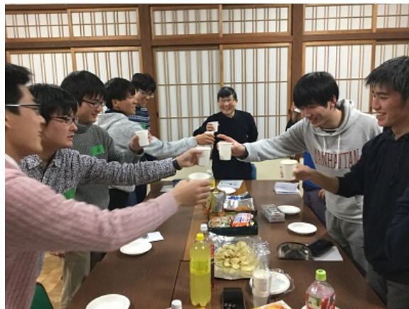
6年間の振り返り。話の尽きない夜でした。