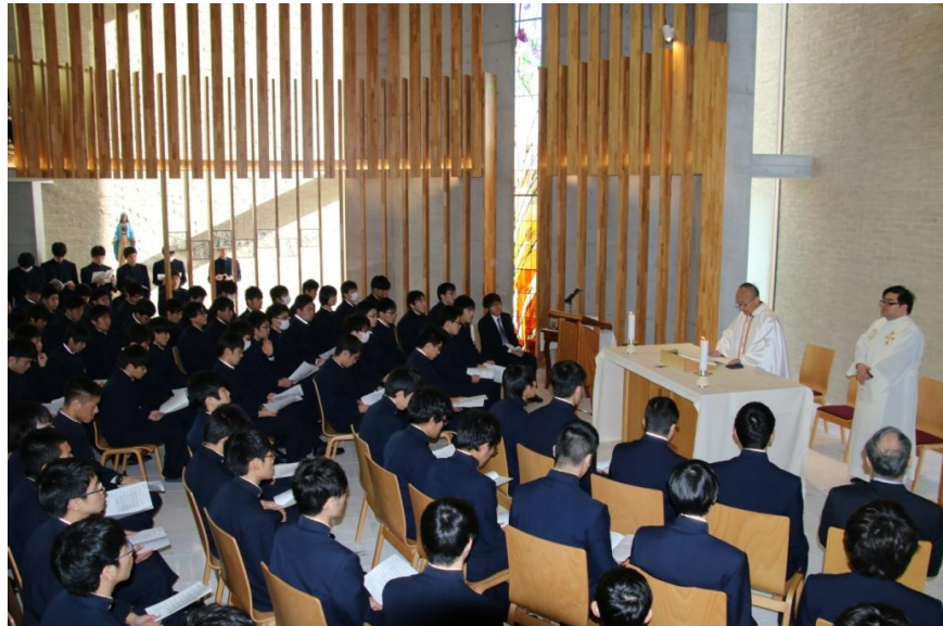
卒業式前に行われた卒業生を送るミサの様子です。