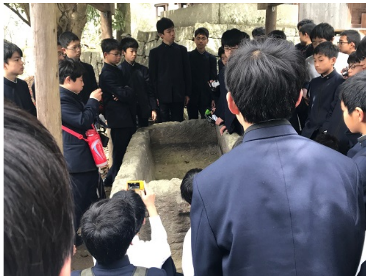
日本第4位の大きさを誇る前方後円墳を実際に登り，そのスケールの大きさを感じました。