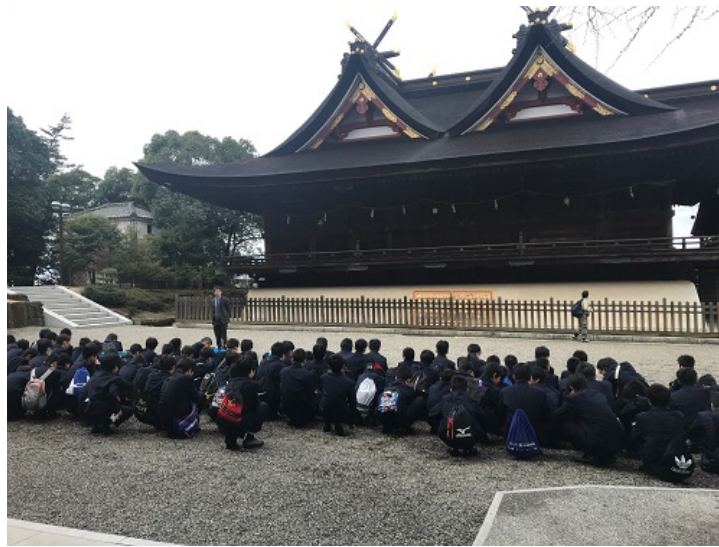
比翼入母屋造を間近に，圧倒されます。