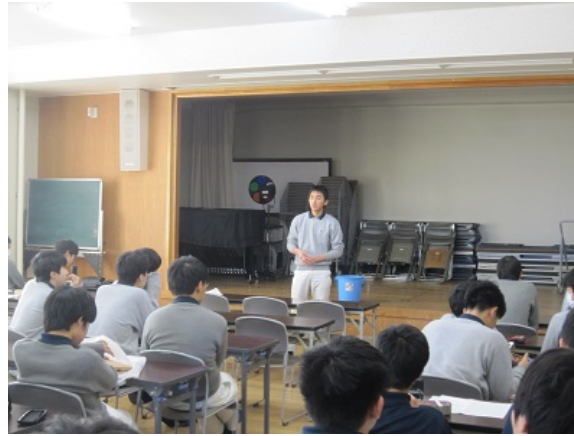
図書委員会も・・・