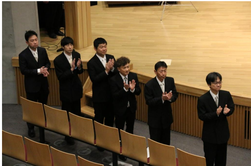
57期の雄姿を見守る担任団。