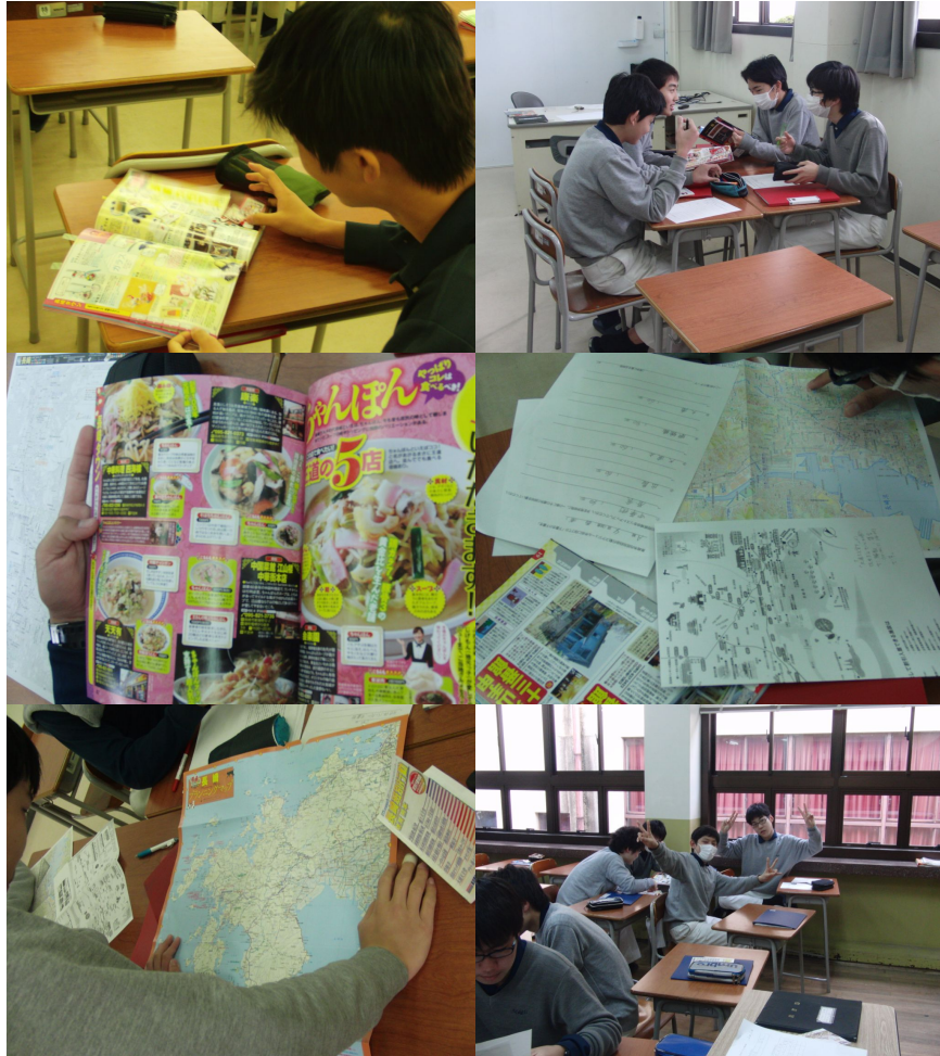
Today practice, tomorrow...

At the end of this month, the 中3 boys will go to Nagasaki for their school trip. In IL (Ignatian Leadership) class they are preparing. On the second to last day, they have four hour of free time to sightsee. However, many students seemed to be more concerned with their stomachs than sights.