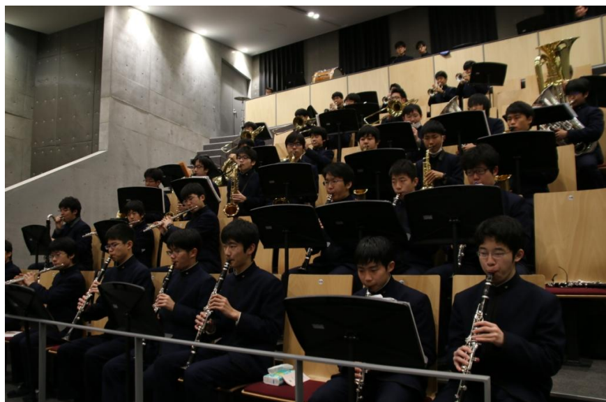
入退場曲はブラスバンド部が演奏しました。