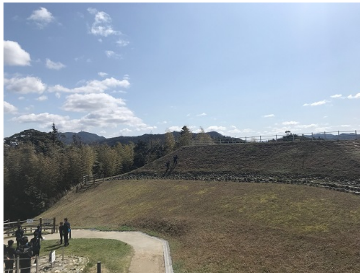
出雲地方特有の四隅突出型墳丘墓を見学。

花より団子ならぬ、遺跡よりエビカニ？ 夕食のバイキングでは、カニ食べ放題でした。