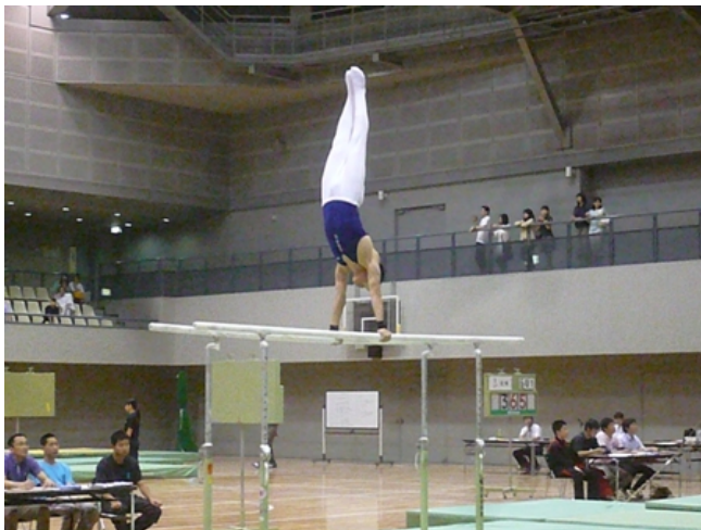
床、鉄棒、跳馬、鞍馬、平行棒、つり輪の6種目を無事こなし、団体総合3位に入賞。 6月21、22日に浜田市で行われる中国大会に進みます。